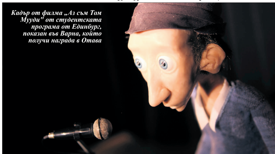
Кадър от филма „Аз съм Том Мууди” от студентската програма от Единбург, показан във Варна, който получи награда в Отава