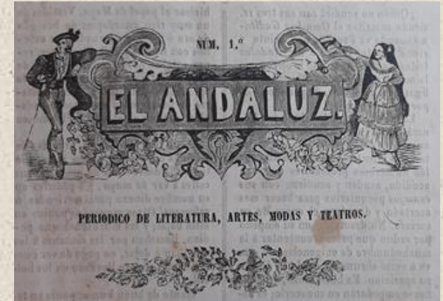
El Andaluz , n.º 1 (7-VII-1844/2-III-1845) Biblioteca de la Fundación Federico Joly Höhr

21 y 22 de febrero, 2024 Facultad de Filosofía y Letras (Cádiz) SALÓN DE GRADOS