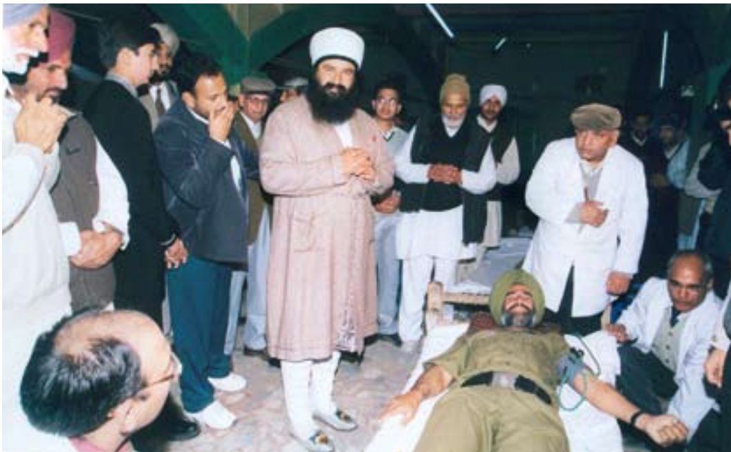
Le gourou Dera Sacha Sauda bénit un disciple qui donne son sang.

plutôt d'une interdépendance mutuellement bénéfique, ou d'une «interopérabilité», entre les mouvements sant – qui utilisent le don bénévole comme un moyen d'enrichir et de transformer la base empirique de leur vie religieuse – et le projet visant à encourager les dons de sang bénévoles en mobilisant de manière stratégique la relation pieuse.