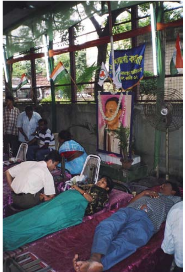
Des militants du parti du Congrès donnent leur sang à Calcutta le 20 août, jour anniversaire de la naissance du Premier ministre Rajiv Gandhi.