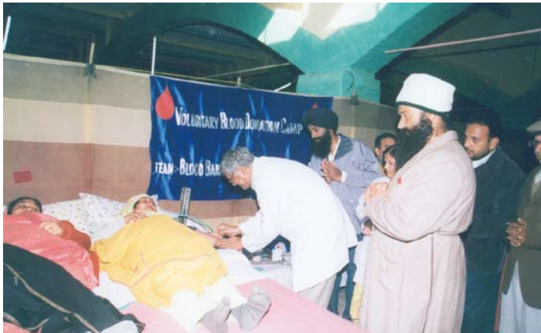
Le gourou Dera Sacha Sauda bénit l'aiguille que le médecin introduit dans le bras d'un donneur.

hors castes, en désespoir de cause, ils devraient accepter la religion de leurs maîtres. On rencontre de nombreux autres exemples, récents, de ce rôle très marqué des substances. Ainsi les disciples nirankari disent-ils : «Le bénéficiaire va avoir le gène d'un Nirankari et rejoindre notre groupe. Nous pouvons nous mettre dans son corps afin qu'il puisse adhérer à notre mission», ou : «Nous éprouvons toujours de l'amour. Nous éprouvons de l'amour et les gènes présents dans notre sang deviennent des gènes d'amour. Ce sang chargé d'amour ira vers d'autres et les affectera pour qu'ils suivent eux aussi la vérité et l'amour.» Une disciple âgée m'a déclaré :